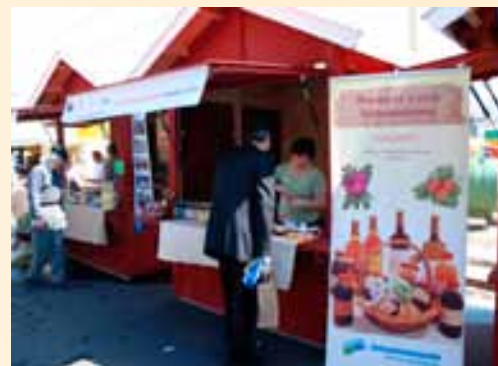
Alejka produktów regionalnych.