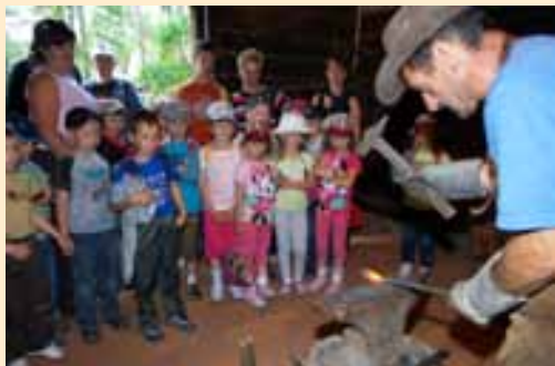
Ginące zawody cieszyły się szczególnym zainteresowaniem wśród najmłodszych.