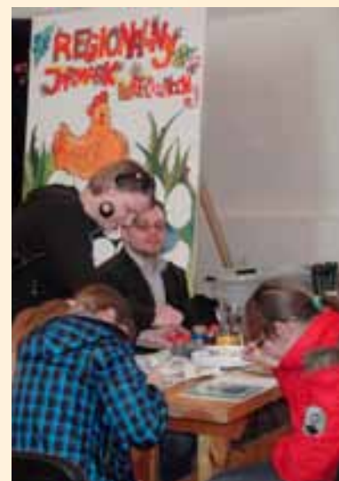
Regionalny Jarmark Wielkanocny.

„Kalendarz imprez regionalnych promujących żywność naturalną, tradycyjną, lokalną i regionalną województwa warmińsko-mazurskiego” w 2011 roku zainauguowały dwa wydarzenia odbywające się w Olsztynku. Pierwszym z nich był „Regionalny Jarmark Wielkanocny” (16 kwietnia 2011 r.), który cieszy się z roku na rok coraz większą popularnością miłośników tradycji wielkanocnych oraz jest okazją do promocji rolników i przetwórców żywności, członków Regionalnej Sieci Dziedzictwa Kulinarne Warmia Mazury Powiśle. Drugim wydarzeniem były „Regionalne VIII Ekologiczne Targi Chłopskie” (7-8 maja 2011 r.). W roku bieżącym, wzorem lat ubiegłych, promocją zostali objęci producenci i przetwórcy ekologicznej żywności certyfikowanej z terenu województwa warmińsko-mazurskiego. W ramach tego wydarzenia, celem przybliżenia konsumentom walorów certyfikowanych produktów ekologicznych oraz stworzenia regionalnego rynku zbytu, przygotowana została ich degustacja.