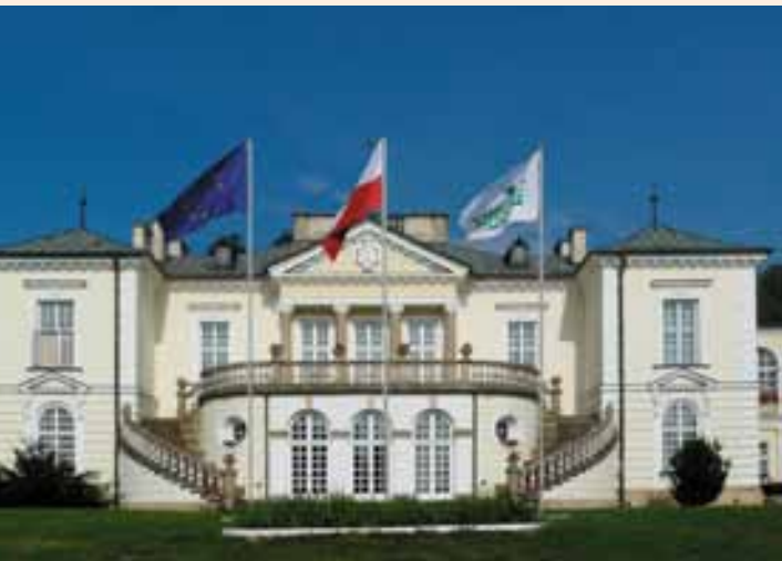
Pałac Radziwiłłów. Siedziba dyrekcji Instytutu.