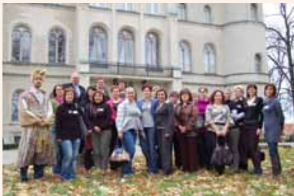
Grupa liderów z LGD Solna Dolina.

umiejętności społecznych, kierowania grupą, sposobów rozwiązywania konfliktów, rozpoznawania mocnych stron członków grupy, a także odpowiedniemu przydzielaniu zadań. Drugi moduł w całości poświęcony jest prawnym zagadnieniom związanym z tworzeniem i funkcjonowaniem organizacji pozarządowych. Zajęcia obydwu modułów uzupełnione są o prezentację dobrych praktyk z działalności organizacji pozarządowych na obszarach wiejskich. Do współpracy przy realizacji projektu zaproszono Lokalne Grupy Działania. W 2010 roku w projekcie uczestniczyły cztery LGD i osiemdziesiąt kobiet z terenu objętego LGD. W 2011 roku do udziału w projekcie zgłosiło się aż dziesięć LGD, z których w zajęciach weźmie udział sto osiemdziesiąt uczestniczek. Zajęcia Szkoły odbywają się w Ośrodku Integracji Europejskiej w Rokosowie. Wiedza i umiejętności nabyte podczas udziału w Szkole Liderów wykorzystywane są przez uczestniczki w pracy społecznej, zawodowej, ale również w życiu prywatnym. Obecnie zgłaszają one zapotrzebowanie na nowe tematy i kontynuację szkoleń.