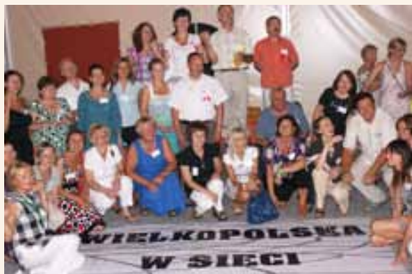
Wielkopolska w sieci. Szkolenie dla LGD.