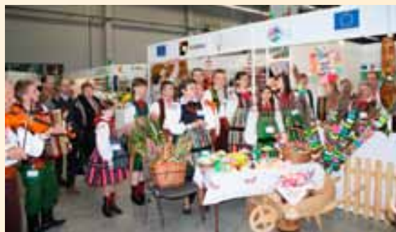
Oferta województwa łódzkiego na targach Agrotavel.

Ponad 100 osób uczestniczyło w konferencji zorganizowanej przez Sekretariat Regionalny KSOW Województwa Łódzkiego, poświęconej tematom związanym z zastosowaniem elementów nowoczesnej gospodarki pasiecznej współfinansowanej ze środków unijnych w aspekcie jakości produktów pszczelich. Prelegenci zaproszeni do udziału w konferencji obok przekazywania wiedzy teoretycznej dzielili się, jakże cenną, wiedzą praktyczną. Podczas sympozjum poruszono m.in. zagadnienia: