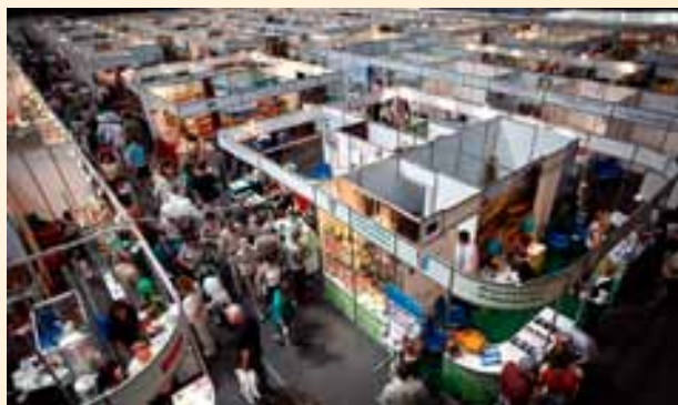
Targi Ekogala w Rzeszowie.