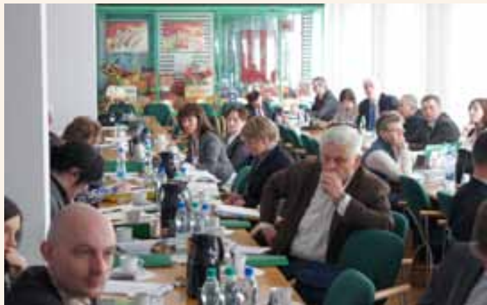
Członkowie Grupy Roboczej ds. KSOW.

Prezentacja sprawozdania zawierała następujące informacje: główny cel Krajowej Sieci Obszarów Wiejskich, partnerzy KSOW na poziomie regionalnym, budżet sekretariatów KSOW na realizację Planu działania, wykorzystanie środków, informacje wskaźnikowe, wykorzystanie środków na funkcjonowanie struktury KSOW.