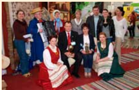
Warmińsko-mazurskie na targach Agrotravel.