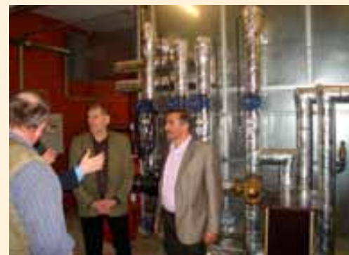
Biogazownia wzbudziła duże zainteresowanie.

Prezentacja osiągnięć rolnictwa niemieckiego, organizacja systemu doradztwa ekonomicznego i technologicznego dla rolników oraz alternatywne możliwości zarabiania na terenach wiejskich były celem wizyty studyjnej przedstawicieli województwa zachodniopomorskiego, która w dniach 14-16 kwietnia 2011 r. odbyła się w niemieckim landzie Schleswig-Holstein. Za organizację wyjazdu ze strony polskiej odpowiedzialny był Zachodniopomorski Ośrodek Doradztwa Rolniczego w Barzkowicach, a ze strony niemieckiej Landwirtschaftlicher Buchführungsverband – Stowarzyszenie Rachunkowości Rolnej w Kilonii. W pierwszym dniu wizyty odbyło się spotkanie w instytucji Lehr- und Versuchsanstalt Futterkamp w Blekendorf, która prowadzi doświadczenia produkcyjne w zakresie produkcji mleka wysokiej jakości oraz tuczu trzody chlewnej. W instytucji prowadzone są także badania wpływu różnych czynników zewnętrznych i genetycznych na jakość plonów roślin uprawnych. W dniu następnym nasza delegacja wizytowała firmę „SAKA – RAGIS” w Windeby, która zajmuje się produkcją nowych odmian ziemniaków. Zaprezentowany został proces produkcji nowej odmiany ziemniaków w zależności od zamierzonego celu hodowlanego. Cały cykl wyhodowania nowych odmian i wprowadzenia ich na rynek