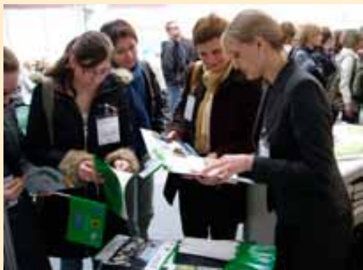
Targi dziedzictwa kulinarного na Pomorzu.

Targi były szansą do poznania potraw tradycyjnych i ich receptur, jak również promocji tych produktów oraz wytyczania szlaków