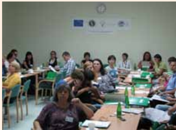
Uczestnicy Krajowej Konferencji na temat: „Ocena funkcjonowania systemu wsparcia dla Lokalnych Grup Działania we wdrażaniu lokalnych strategii rozwoju – doświadczenia i przyszłość”, zorganizowanej we współpracy z Sekretariatem Centralnym KSOW w dniach 25-27.05.2011 w Krakowie.

tekstów dziennikarskich mogą się do mnie zwrócić o koleżeńską pomoc.