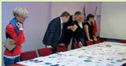
Komisja konkursowa w trakcie oceny prac.