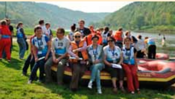
Konferencji towarzyszyły zawody sportowe.