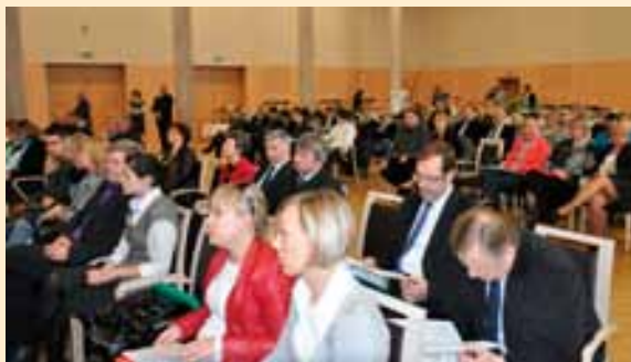
Uczestnicy konferencji nt. przetwórstwa surowców rolniczych.