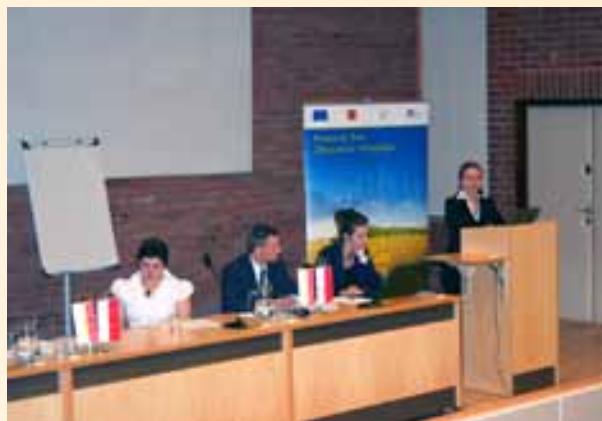
Konferencja w sprawie przyszłości podejścia Leader.