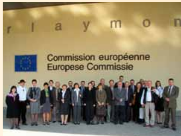
Wizyta w Brukseli.

Odbył się również pokaz rękodzieła, który miał charakter miniwystawy rozmaitych wyrobów, charakterystycznych dla górali beskidzkich. Znalazły się tam przykłady: najśłynniejszych koronek – z Koniakowa, rzeźby, ceramika, bibułkarstwo (bibułkowe kwiaty – specjalność Żywiecczyny), wyroby wełniane. Całości imprezy towarzyszył koncert muzyki góralskiej, który połączony był z degustacją produktów tradycyjnych (serów owczych, chleba tradycyjnego, smalcu, ogórków kwaszonych, kołaczy itd.). Muzycy w regionalnych strojach zaprezentowali utwory ludowe charakterystyczne dla muzyki Karpat). Podczas prezentacji regionalnych utworów muzycznych uczestnicy seminarium mieli także okazję do rozmowy i wymiany doświadczeń, a także zapoznali się z kulturą beskidzką.