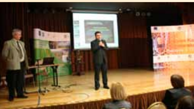
Międzynarodowa konferencja pszczelarzy.

W dniach 05.04 – 07.04.2011 w Pszczynie odbyła się Międzynarodowa Naukowa Konferencja Pszczelarska poświęcona upamiętnieniu 200. rocznicy urodzin wybitnego śląskiego pszczelarza i naukowca ks. dr Jana Dzierżona. W ramach konferencji organizowane były sesje plenarne, sesje posterowe oraz spotkania towarzyszące w kilku blokach tematycznych. Głównymi zagadnieniami tematycznymi były: hodowla i genetyka pszczół, gospodarka pasieczna, choroby i zatrucia pszczół, pożytki pszczele oraz apiterapia. Ponadto, w jubileuszowym 2011 roku, zorganizowano okolicznościowy blok tematyczny poświęcony osobie ks. J. Dzierżona, jego osiągnięciom naukowym i ich wpływowi na rozwój współczesnego pszczelarstwa. Uczestnikami Konferencji byli naukowcy z wielu krajów Europy zajmujący się badaniami z zakresu pszczelnictwa oraz pszczelarze praktycy. Podczas konferencji, ze