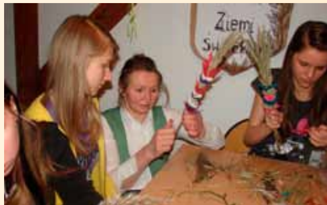
Warsztaty Umiejętności Kulinarnych – „Palmy i baranki – kuchnia obrzędowa” – Gruczno 2011

Sekretariat Regionalny Krajowej Sieci Obszarów Wiejskich Województwa Kujawsko-Pomorskiego był współorganizatorem warsztatów pn. „Palmy i baranki – kuchnia obrzędowa”, które odbyły się w dniach 2-3 kwietnia 2011 roku w Grucznie, oraz pokazów wyplatania palm. Przedsięwzięcie było skierowane między innymi do członków Lokalnych Grup Działania, właścicieli gospodarstw agroturystycznych. Podczas Warsztatów Umiejętności Kulinarnych przybliżono kilka potraw mocno związanych z Wielkim Postem, zarówno tych dla bogatych, jak i ubogich: zupę rybną z karasków, lina, szczupaka, gramatkę, czyli polewkę piwną, rzepę pieczoną z powidłami, kociewską grochówkę ze śledziem, omlęt z kompotem z wisien. Warsztaty prezentowały prawdziwą sztukę kulinarną – smaczne i zdrowe potrawy, nieprzeładowane frymuśnymi dodatkami czy drogimi składnikami. Na warsztatach trenerki z Litwy przekazywały tajniki wykonywania palm – tradycji ściśle związanej z okresem Wielkiego Postu i Niedzielą Palmową, zwanej też „Kwietną” czy „Wierzbną”. Podczas Warsztatów Umiejętności Kulinarnych pn. „Amory i alchemia w kuchni”, które odbyły się w dniach 11-12 lutego 2011 roku w Chełmnie, uczestnicy poznawali tajniki używania przypraw i dodatków, potraw z nietypowych podrobów baranich, jagnięcych i koźlęcych, przyrządzania ryb i skorupiaków, sporządzania deserów, napojów i sodyczy z czekoladą. Szkolenie, prowadzone przez specjalistów od kulinariów, skierowane było do członków Lokalnych