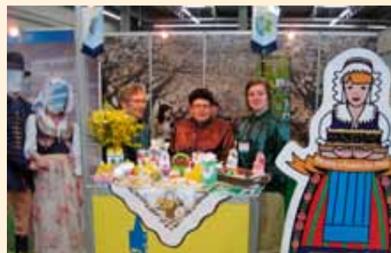
Opolskie zaprezentowało bogatą ofertę turystyczną na targach Agrotavel.

W dniach 15-17 kwietnia 2011 r. województwo opolskie prezentowało atrakcje turystyki wiejskiej oraz produkty tradycyjne i regionalne podczas III Międzynarodowych Targów Turystyki Wiejskiej i Agroturystyki „Agrotavel” w Kielcach. Organizatorami targów byli: Minister Rolnictwa i Rozwoju Wsi, Minister Sportu i Turystyki, Marszałek Województwa Świętokrzyskiego, Prezes Polskiej Organizacji Turystycznej, Prezes Regionalnej Organizacji Turystycznej Województwa Świętokrzyskiego oraz Prezes Targów Kielce Sp. z o.o. W tegorocznej edycji targów uczestniczyło 140 wystawców z kraju i zagranicy oraz szerokie grono osób odwiedzających halę targową. Opolszczyznę prezentowały 3 Lokalne Grupy Działania, tj. „Kraina Św. Anny”, „Nyskie Księstwo Jezior i Gór” oraz „Stobrawski Zielony Szlak”. Uczestniczące w targach LGD przedstawiły podczas targów swoje oferty turystyczne, agroturystyczne oraz rękodzieło i produkty kulinarne. Targi okazały się znakomitą promocją usług turystycznych oferowanych przez gospodarstwa agroturystyczne z obszaru opolskich LGD, stając się równocześnie platformą wymiany doświadczeń i wiedzy osób i instytucji prowadzących działalność na rzecz jej rozwoju. Atrakcyjność oferty agroturystyki w siedzibie przedstawionej przez LGD Stobrawski Zielony Szlak „Justyna Cierpisz – Babskie Ranczo” (Śmiechowice) została nagrodzona Nagrodą Posła do