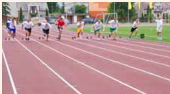
Jedną z dyscyplin I Letniej Spartakiady KSOW były biegi.

W klasyfikacji punktowej miejsca na podium w kolejności od najwyższego zajęły drużyny: województwa wielkopolskiego, województwa zachodniopomorskiego i Ministerstwa Rolnictwa i Rozwoju Wsi. W klasyfikacji medalowej pierwsze miejsce zajęła drużyna województwa wielkopolskiego, drugie Ministerstwa Rolnictwa i Rozwoju Wsi, a trzecie województwa zachodniopomorskiego.