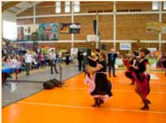
Laureatki konkursu w kategorii kankan.