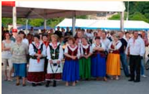
Festiwalowi towarzyszyła bogata oprawa artystyczna.

W ramach uroczystości wręczone zostały statuetki, dyplomy i licencje oraz Nagroda Specjalna – Statuetka Ministra Rolnictwa i Rozwoju Wsi dla firmy wyróżniającej się osiągnięciami rynkowymi w branży rolno-spożywczej. Dodatkową atrakcją „Ekogali 2011” była udana próba pobicia Rekordu Guinnessa w kategorii na największy na świecie tort w kształcie piramidy Taubera – wynik ponad 1,7 m wysokości. Tort został następnie podzielony na 10 tysięcy porcji, a 40 kelnerów – uczniów Zespołu Szkół Spożywczych i Zespołu Szkół Gospodarczych – rozdało je gościom odwiedzającym targi. Kolejną atrakcją trzeciego