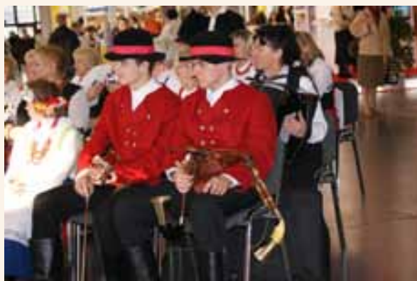
Zespół Goślinianie przed występem na targach Tour Salon.