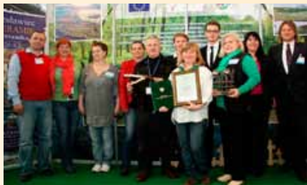
Dolnośląskie na targach Agrotravel.