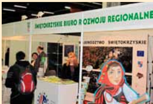
Świętokrzyskie na targach Agrotavel.