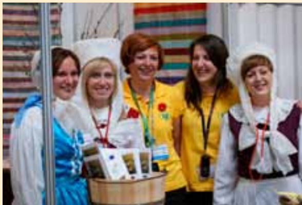
Wielkopolska na targach Agrotravel.