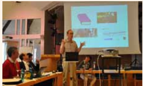
Jedenaste spotkanie europejskich sieci obszarów wiejskich.