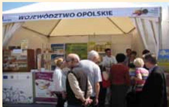
Województwo opolskie promuje swoje produkty na kiermaszu w Szczecinie.

Województwa Zachodniopomorskiego oraz Międzynarodowe Targi Szczecińskie. W specjalnej strefie zorganizowanej przy Wałach Chrobrego producenci z 11 województw prezentowali produkty tradycyjne najwyższej jakości. Odwiedzający mieli możliwość spróbować i zakupić produkty oraz dowiedzieć się od producentów, co cechuje tradycyjną żywność i sprawia, iż jest ona wyjątkowa oraz cieszy się coraz większą popularnością. Na stoisku województwa opolskiego promowane były produkty tradycyjne z 3 lokalnych grup działania: kapusta kiszona z Bobrowy (LGD Górna Proсна), olej głuźczycki rzepakowy tłoczony na zimno (LGD Płaskowyż Dobrej Ziemi), kołocz śląski, krajanki, anyżki, opolskie ciasteczka ze skwarek (LGD Euro Country). Oprócz naszych produktów tradycyjnych na kiermaszu można było zakupić i spróbować m.in.: Piernikowe Chatki znad Mrogi, Piwa Łarskie, Miody z Doliny Rzeki Mrogi, Nadwarciański Chrzan po Staropolsku, Kwas Chlebowy, Ogórki Kwaszone Spod Wielunia, Sękacz Mazurski, Andruty Kaliskie, Rogale Świętomarcińskie oraz wiele innych regionalnych specjałów. Szczecinianie i goście Pikniku nad Odrą – nie wyjeżdżając z miasta – mieli możliwość odbycia podróży kulinarnej po różnych częściach Polski, w tym między innymi do województwa opolskiego. To była prawdziwa uczta kulinarna, którą osłodził nasz sztandarowy produkt tradycyjny – Kołocz Śląski, przyciągając tłumy smakoszy na stoisko.