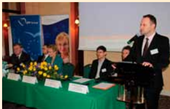
Konferencja na temat energii odnawialnych.