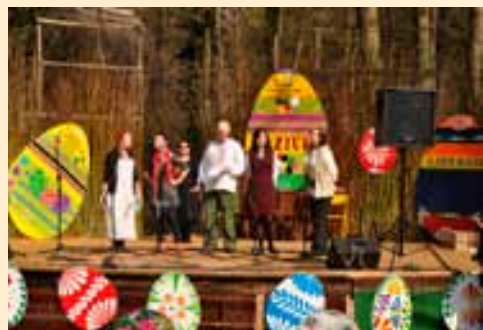
Jarmark kaziukowy cieszył się dużym zainteresowaniem.

Na terenie Skansenu w Muzeum Etnograficznym w Ochli, w dniu 3 kwietnia, już po raz kolejny odbył się Jarmark Kaziukowy. Wszyscy licznie przybyli mieli możliwość, wziąć udział w warsztatach pisankarskich oraz wicia palm wileńskich, spróbować potraw wileńskich, czy przejechać się bryczką. Na jarmarku można było również nabyć, cieszące oko, przepiękne tradycyjne palmy, pisanki, wyroby z wikliny, obrusy haftowane, rzeźby, wyroby z drewna czy też z siana, a to wszystko przy akompaniamencie muzyki zespołów folklorystycznych.