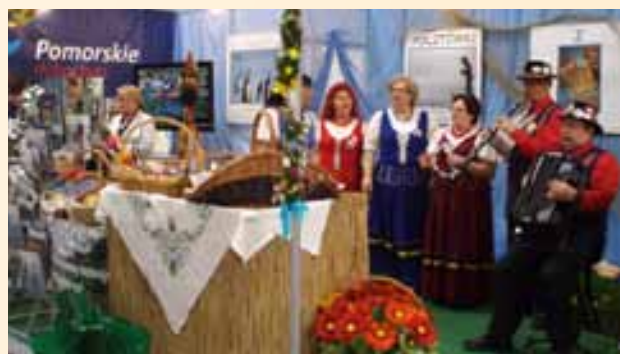
Pomorskie na targach Agrotour.

W dniach 15-17.04.2011 roku w Kielcach odbyły się III Międzynarodowe Targi Turystyki Wiejskiej i Agroturystyki Agrotour, podczas których wystawcy ze wszystkich regionów Polski oraz z zagranicy promowali lokalne atrakcje turystyczne. Ofertę agroturystyczną i atrakcje obszarów wiejskich Pomorza prezentowały Lokalne Grupy Działania z województwa pomorskiego oraz przedstawiciele Urzędu Marszałkowskiego i Sekretariatu Regionalnego KSOW. Odwiedzający nasze stoisko mogli uzyskać informacje zarówno na temat miejsc noclegowych, jak i miejsc, które warto od-