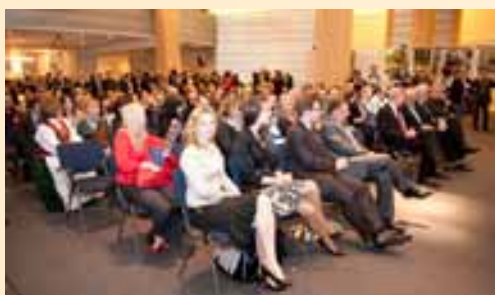
Uczestnicy wystawy tradycji wielkanocnych na Kurpiach w Brukseli.