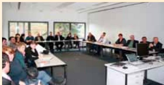
Wyjazd studyjny do Berlina.

W kolejnym dniu wyjazdu grupa wzięła udział w międzynarodowych targach turystycznych ITB odbywających się w Berlinie. Jest to jedna z największych imprez branży turystycznej, gdzie można zapoznać się z ofertą biur podróży z całego świata. W tym roku Polska była krajem partnerskim i współorganizatorem targów. Ofertę polską przedstawili wystawcy z 16 regionów kraju, a także miasta będące gospodarzami przyszłorocznych Mistrzostw Europy w Piłce Nożnej: Warszawa, Poznań, Wrocław, Gdańsk.