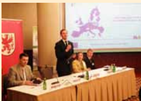
Konferencję otworzył Marszałek Województwa Zachodniopomorskiego.