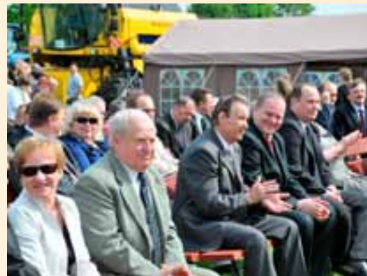
Uczestnicy III Forum Rolniczego.