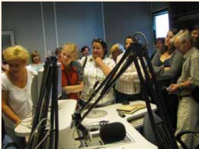
Zajęcia w studio radiowym Radia Kraków Małopolska. [FOT. CDR O/KRAKÓW]