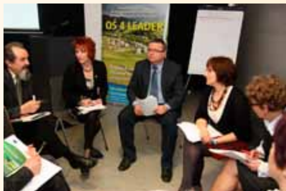
Dyskusja nad przyszłością podejścia Leader.

Jednym z głównych celów konferencji było podsumowanie dotychczasowych doświadczeń, identyfikacja problemów i dobrych praktyk w trakcie wdrażania działań z Osi IV PROW 2007-2013, Leader.