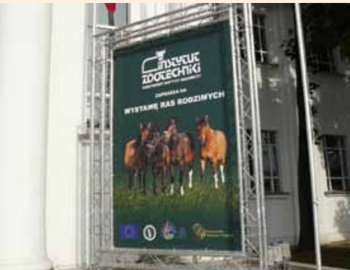
Instytut na targach w Poznaniu.