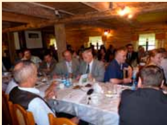
Konferencja w Korycinach.

Sekretariat Regionalny Krajowej Sieci Obszarów Wiejskich Województwa Podlaskiego uczestniczył w dniach 11-12 maja 2011 roku w spotkaniu dotyczącym sektora ekologicznych ziół organizowanym przez Ministerstwo Rolnictwa i Rozwoju Wsi oraz Stowarzyszenie Rozwoju Regionalnego. Odbyło się ono w wyjątkowo adekwatnej scenografii gospodarstwa „Ziołowy Zakątek” w Korycinach.