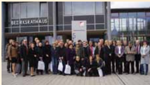
Wyjazd studyjny do Frankonii.