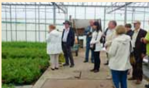
W Holandii zwiedzano między innymi gospodarstwa rolne i agroturystyczne.

był współfinansowany ze środków Schematu III Pomocy Technicznej w ramach „Spotkań z tradycją”.