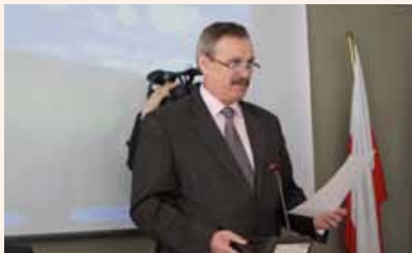
Podsekretarz Stanu w MRiRW Tadeusz Nalewajk otwiera posiedzenie GR ds. KSOW.

Następnie został przedstawiony projekt sprawozdania z realizacji Planu działania KSOW za 2010 rok.