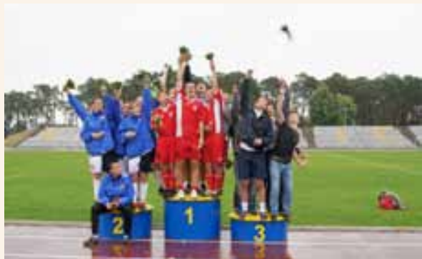
Na podium zdobywcy trzech pierwszych miejsc w piłce nożnej.

Ponad setka zawodników rywalizowała w takich dyscyplinach, jak biegi krótkie i długie, tenis stołowy, pływanie, piłka nożna, siatkówka, dart oraz wielobój (tor przeszkód). W części dyscyplin kobiety i mężczyźni startowali osobno, w części razem, tworząc zespoły mieszane.