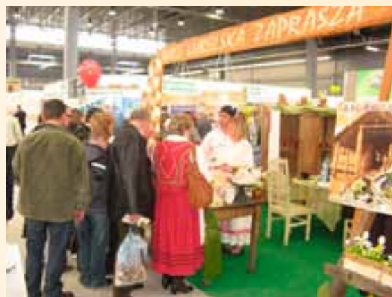
Stoisko na targach Agrotravel.