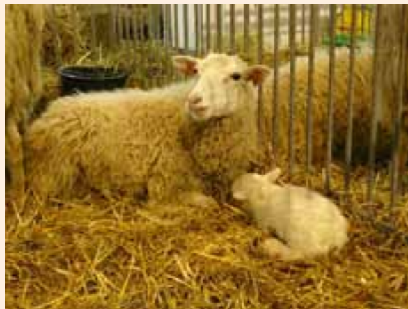
Ochrona ras rodzimych to ważna działalność Instytutu